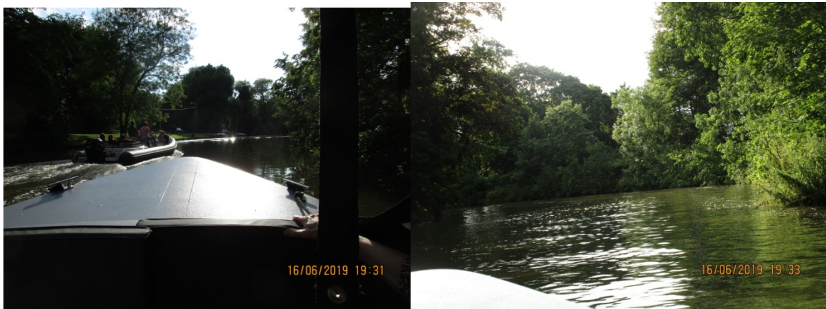
Ondertussen genoten we van de omgeving. We zijn veilig aangekomen en zelfs het aanmeren hebben we ter plekke geoefend. Ondertussen waren onze vrienden door de botencentrale 'gesleept' terug naar de haven. En zijn ze met hun auto's naar de Nenuphar gereden.