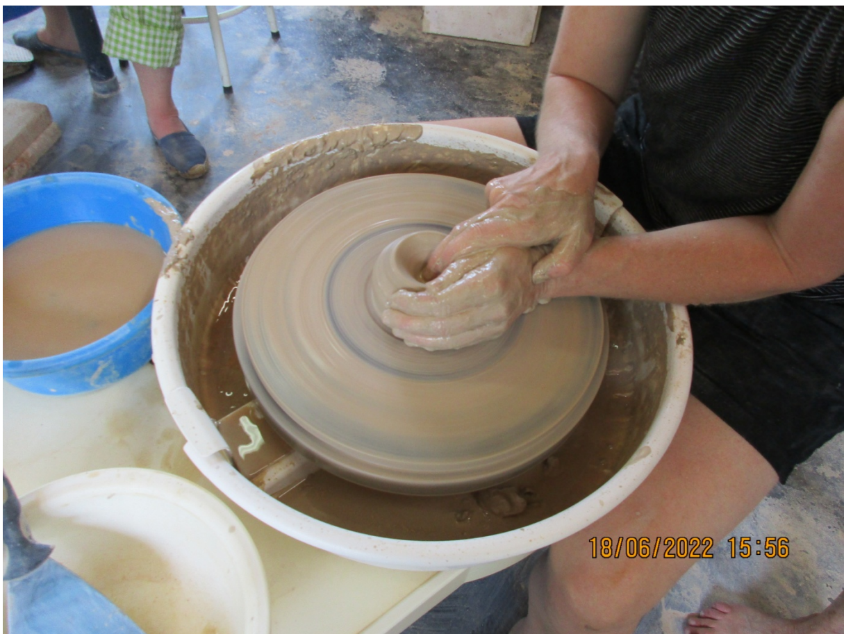
Fase 2: kuiltje maken. Weet je nog? Water, met wijsvinger en steun het kuiltje open trekken.